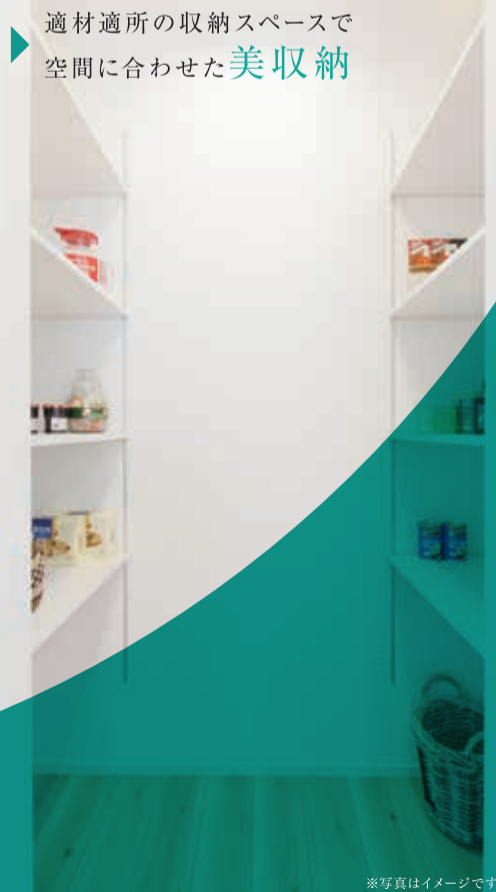
適材適所の収納スペースで 空間に合わせた美収納