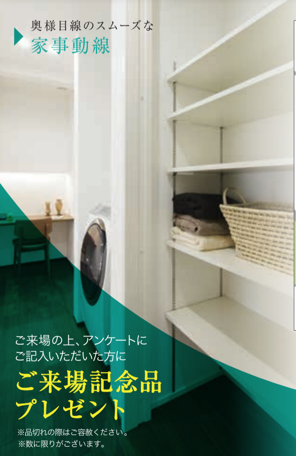
奥様目線のスムーズな 家事動線

完全予約制 桑名展示場にてご予約を承ります。 お気軽にお問い合わせください。 0120-66-3546