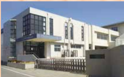
「有緝小学校」徒歩約14分

明和展示場限定のオススメ物件です。緑豊かな住環境、伊勢市駅に程近く、買物や通勤・通学にも便利な 限定2区画を期間限定のお値段で販売致します。この機会をお見逃しなく。