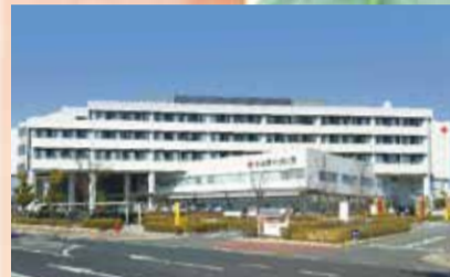
「伊勢赤十字病院」徒歩約12分