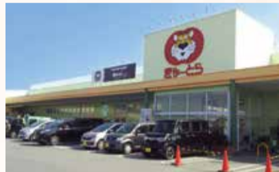
「ぎゅーとらハイジーン店」徒歩約2分