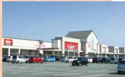
「ミタス伊勢」徒歩約12分