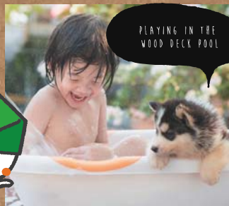
PLAYING IN THE WOOD DECK POOL