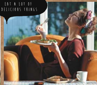
EAT A LOT OF DELICIOUS THINGS