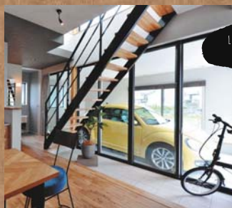
LIVE WITH A SMILE EVERY DAY