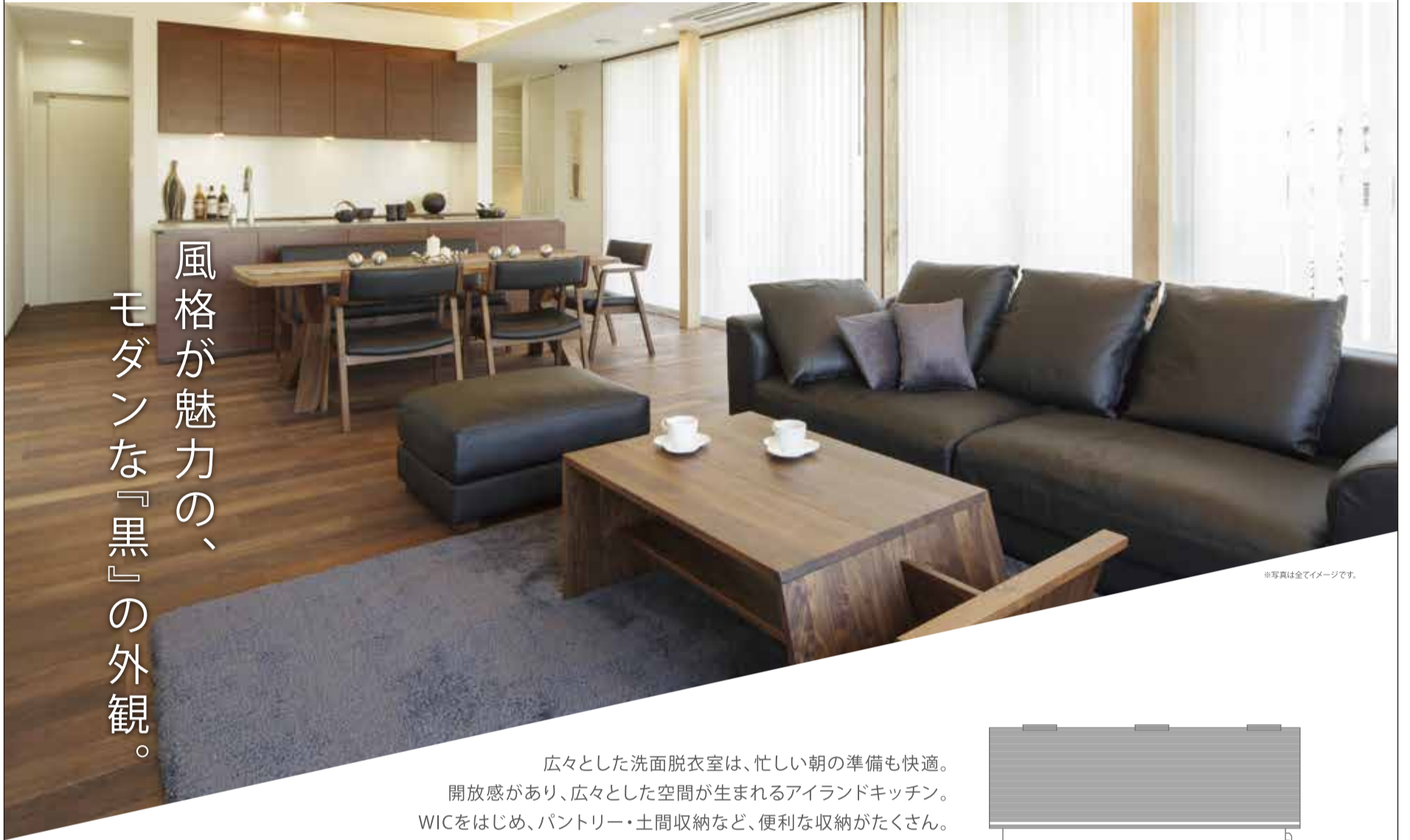
※写真は全てイメージです。