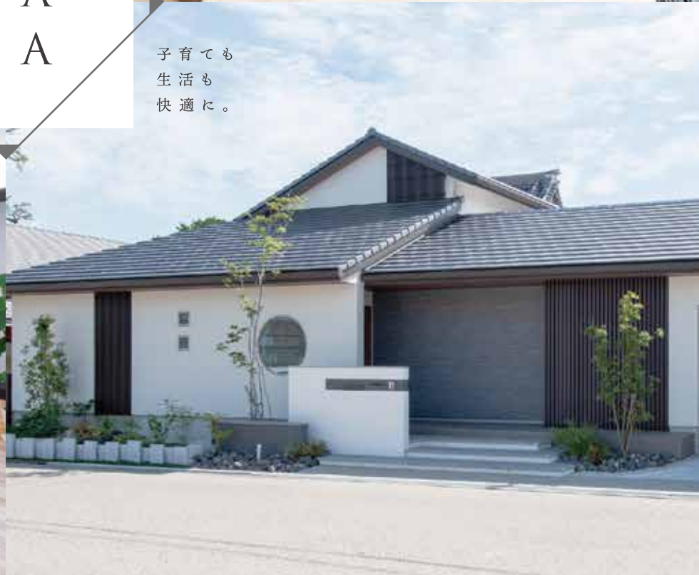
※写真は施工事例です。