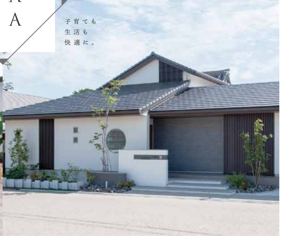
※写真は施工事例です。