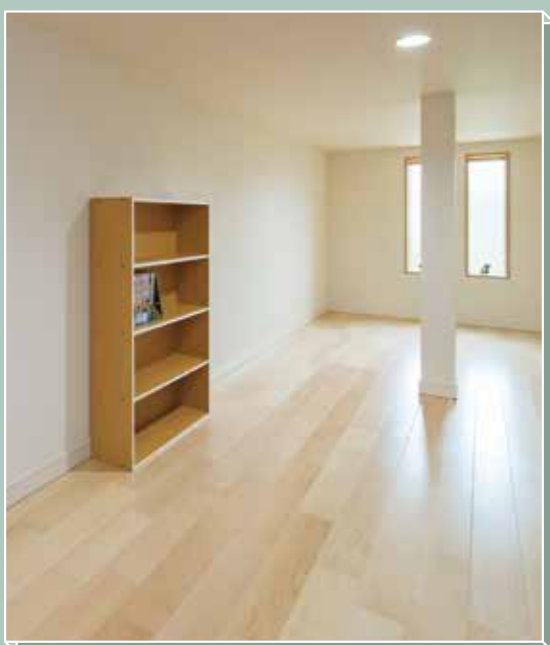
外断熱を活かした屋根裏空間