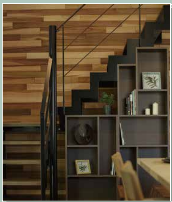
コミュニケーションが取りやすいリビング階段