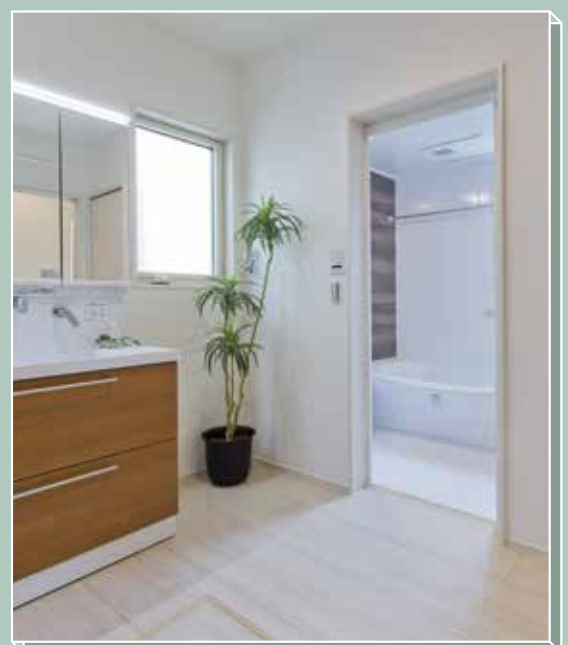
ストレスフリーに生活できる家事ラク動線