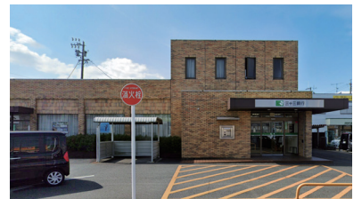
三十三銀行 小俣支店