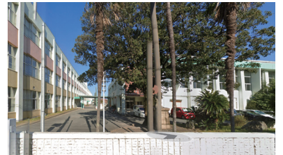
伊勢市立 小俣小学校