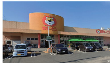
ぎゅーとら 小俣店