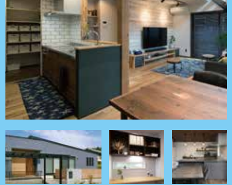
*写真は当社施工事例となります。