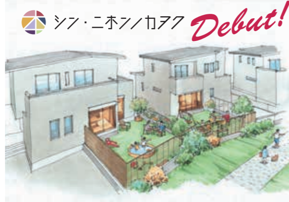
シン・ニホンノカク