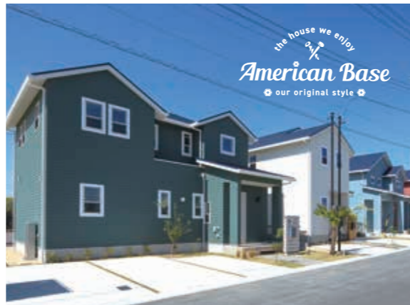
アメリカンベース