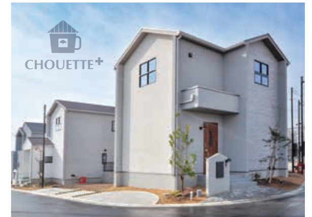
シュエットプラス