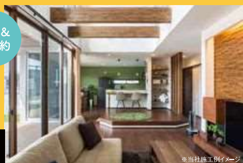
※当社施工例イメージ

オーナー様邸と杜の街展示場のW見学で Amazonギフト券 3,000円分 進呈!