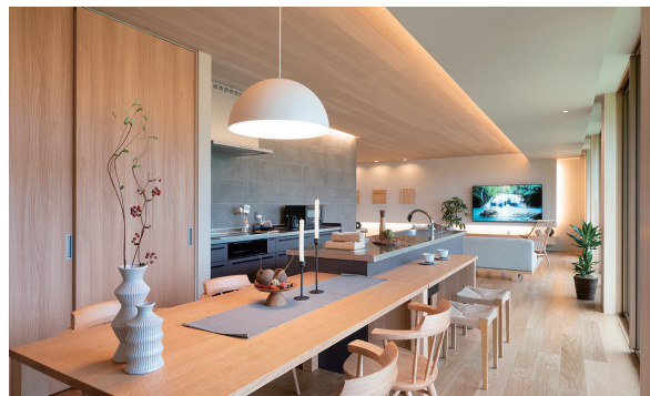
小上がりのタタミやキッチンとつながるダイニングなど、居場所がたくさん。

美しい水平・垂直ラインが奏でる、ノイズのない造形美。 落ち着きやすらぎをもたらす、間接照明や細部にまでこだわっ たしつらえ。空間の広がりともとまりを両立させた美しいデザイン が、ゆたかな暮らしを創造します。