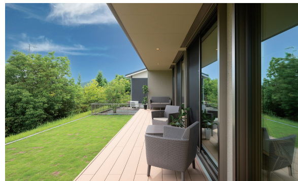
構造の強さを活かした深い軒のあるデッキはセカンドリビングにも。

外気の影響を受けず省エネにも貢献する、内断熱・外断熱の 「ダブル断熱」に加え、屋根断熱までを施した高性能な住まい。 夏は涼しく、冬は暖かく過ごせるハイレベルな住環境で、快適か つ健康的な毎日をお届けします。