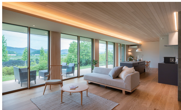
日々の喧騒を忘れさせてくれる、開放的な空間。

強靱な構造を活かした、柱や壁のない開放的なLDK。 タタミコーナー・ホールを合わせると、トータル約40帖の大空間。 住まう人の暮らしやライフスタイルの変化に合わせて間仕切り 自在な、スケルトン・インフィル構造です。