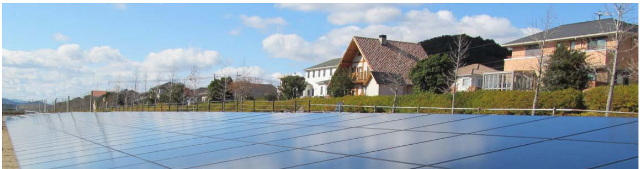
(写真は伊勢二見メガソーラー光の街)