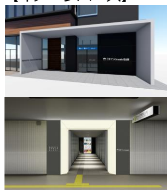
(上)1階正面エントランス(下)地下1階連絡通路