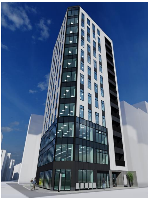
(仮称)中村区椿町ビル建設計画 外観パース ※イメージパース、データでのご提供いたします